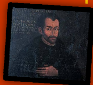
Padre António de Andrade (1580 – 1634)

El punto de partida fue la figura de Padre António de Andrade, héroe local, misionero nacido en Oleiros, en el siglo XVI, "escalador del Himalaya y descubridor del Tíbet".