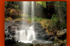
Cascadas de la Fraga da Água d'Alta