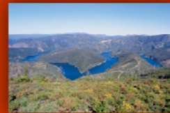
Meandros del río Zêzere

Oleiros es un de los 6 municipios que constituyen los 4617 km 2 del Geopark Naturtejo. Se encuentra en NW del territorio, con una área de 465,82 km 2 e aproximadamente 6000 habitantes (datos de 2006).