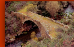
Ponte das Felgueiras